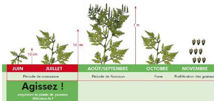
Cycle de la vie de l'ambroisie à feuille d'armoïse

L' Ambroisie à feuille d'armoïse est une plante dont le pollen provoque de fortes réactions allergiques entre août et octobre : rhinites, conjonctivites, asthme, etc. Sa prolifération est favorisée par les sols nus et/ou certaines cultures (tournesol, soja, maïs, etc.)