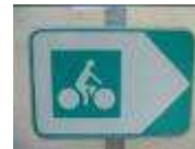
Exemple d'un panneau signalétique de l'itinéraire structurant

Dès 2007, en Charente, les véloroutes forment un « grand huit » de part et d'autre du département. Ces itinéraires ont spécialement été sélectionnés pour leur faible trafic routier.