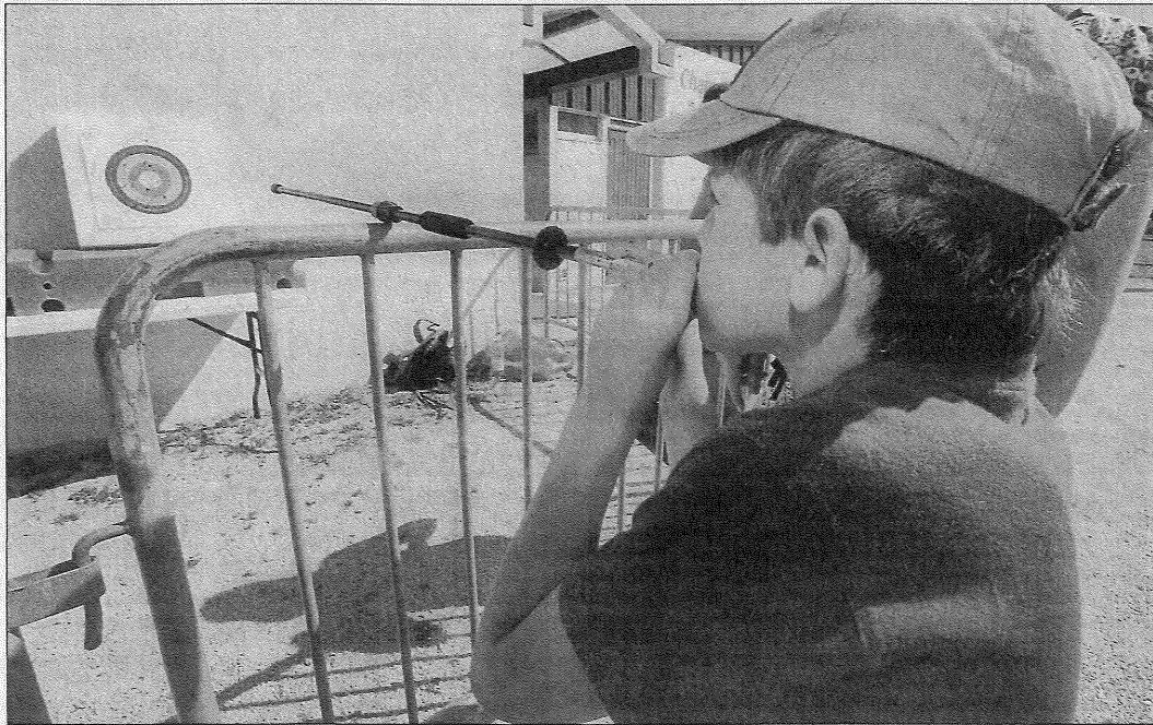
450 écoliers du Ruffécois se sont retrouvés hier au complexe sportif de Mansle pour participer aux différents ateliers.

■ 450 écoliers se sont retrouvés hier à Mansle pour clôturer le programme d'éducation nutritionnel dans le Ruffécois ■ De la théorie à la pratique.